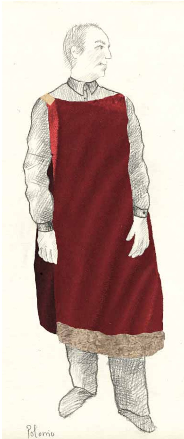
Diseños realizados por Monica Florensa